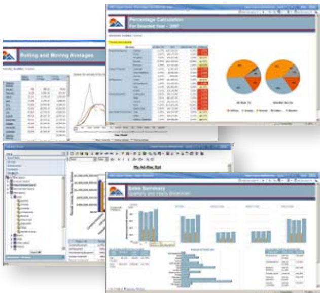
Eine intuitive, benutzerfreundliche Schnittstelle erlaubt umfassenden Self-Service-Zugriff auf Berichte und Analysefunktionen.